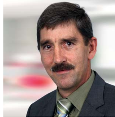
Hubert Strigel Eigentumsverwaltung