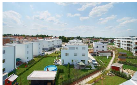
Wohneigentum am Paarbogen in Mering