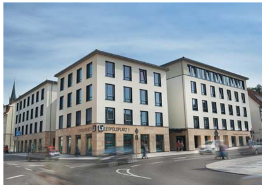
Zum Jahreswechsel 2013/14 hat die GSW ihre Geschäftsräume in die Innenstadt Sigmaringens verlegt, wo mit dem LEOPOLDPLATZ 1 ein modernes Ärzte- und Dienstleistungszentrum erstellt wurde.