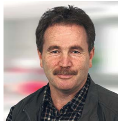
Josef Glaser Hausmeisterservice Sigmaringen