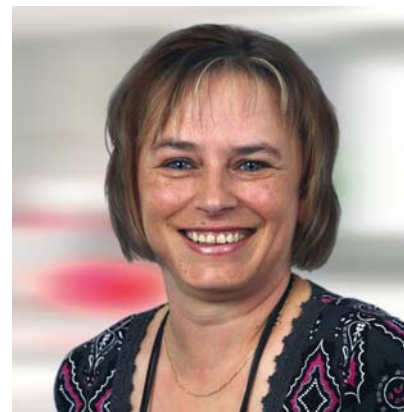
Beate Russo Mietsonderverwaltung