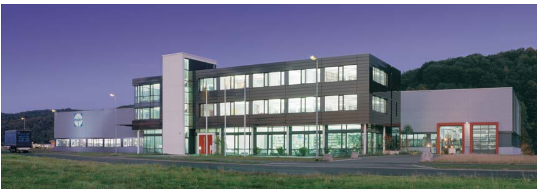
In Tübingen errichtete die GSW in nur zwei Monaten reiner Bauzeit einen Industriekomplex mit insgesamt 5.000 m 2 Nutzfläche inklusive Verwaltungsgebäude, Fertigungs- und Lagerhalle.