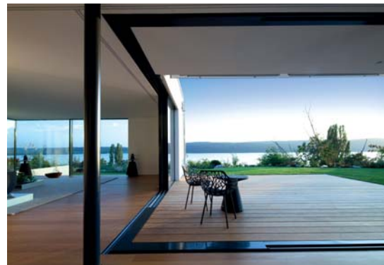
Exklusives Wohnen inklusive Seeblick in Überlingen