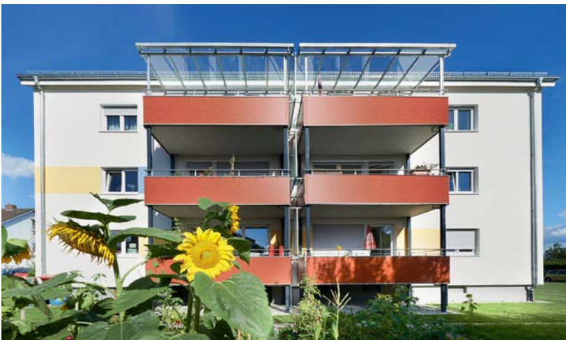
Eines von fünf modernisierten Häusern in Ihringen

Gut ist uns nicht gut genug! Deshalb investiert die GSW jedes Jahr mehrere Millionen Euro in die Instandhaltung und Modernisierung ihres Bestands. Unsere Mieter profitieren somit nicht nur von mehr Komfort, sondern auch von einer besonders energieeffizienten und klimaverträglichen Bauweise. Ob moderne Gasbrennwerttechnik, Solaranlagen oder innovative Wärmepumpen – die energiesparenden Wohnungen der GSW schonen nicht nur die Umwelt, sondern auch den Geldbeutel ihrer Mieter.