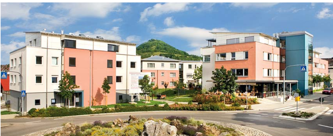
Seniorenresidenz mit betreuten Wohnungen im Herzen von Eningen u. A.

Mit einem starken und vertrauensvollen Partner an Ihrer Seite gelten Immobilien schließlich vollkommen zu Recht als eine der besten Möglichkeiten, die eigene Zukunft komfortabler, angenehmer und glücklicher zu gestalten.