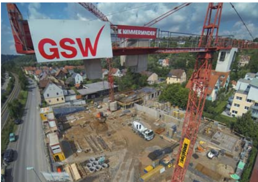
Die GSW baut in Rottenburg am Neckar in idealer Lage eine Wohnanlage „Porta Suevica“ mit 44 Wohnungen und zwei Gewerbeeinheiten.

Als modernem Immobilienunternehmen ist uns klar: Das Wohnen endet nicht an der Haustür. Ein echtes Zuhause braucht eine lebendige Umgebung mit jeder Menge Raum zum Einkaufen, Arbeiten, Essen gehen, Kultur erleben, einer nahen Gesundheitsversorgung u. v. m. Aus diesem Grund baut die GSW nicht nur Wohnungen, sondern hat sich auch im Gewerbe- und Industriebau, im Städtebau sowie bei Erschließungsmaßnahmen als beliebter Partner für Städte, Gemeinden und Privatinvestoren ausgezeichnet.