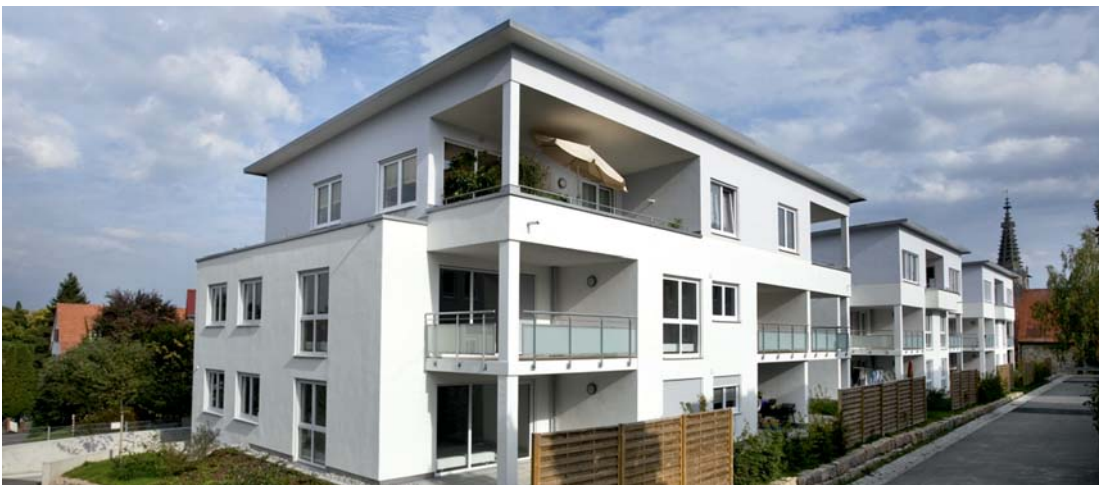
Hochwertige Eigentumswohnungen am Römertempel in Rottenburg – von der GSW bestens verwaltet

Die Eigentumsverwaltung der GSW entlastet Sie zeitlich, verringert die Kosten Ihrer Immobilie und optimiert die Rendite Ihrer Kapitalanlage.